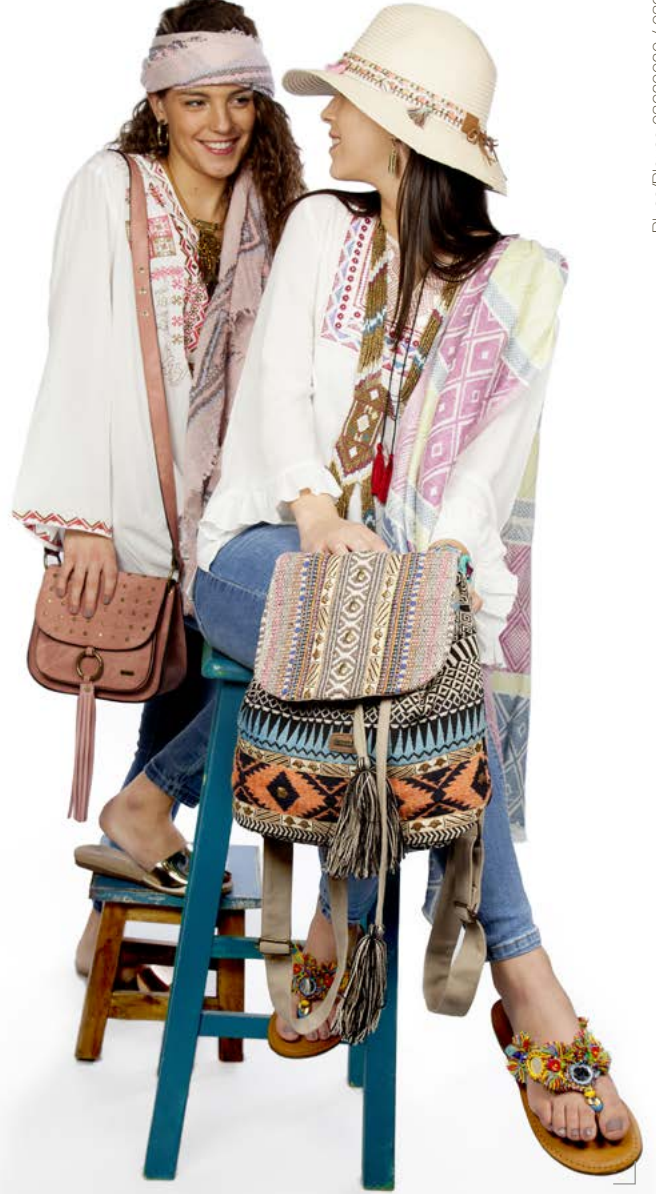
Blusa/Blouse 08920020 / 08920025