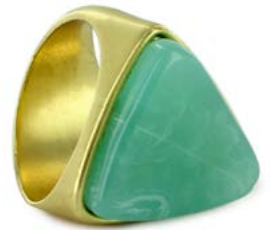
01 Anillo/Ring 06172236.

The blue of the sea and the green of our forests and jungles, the conservation of the ecosystem, caring for our atmosphere, oceans and earth, is the leitmotif inspiring this eco trend (which is not just an appearance but an essence) and which tries to enjoy, care for and know more and better about the nature surrounding us.