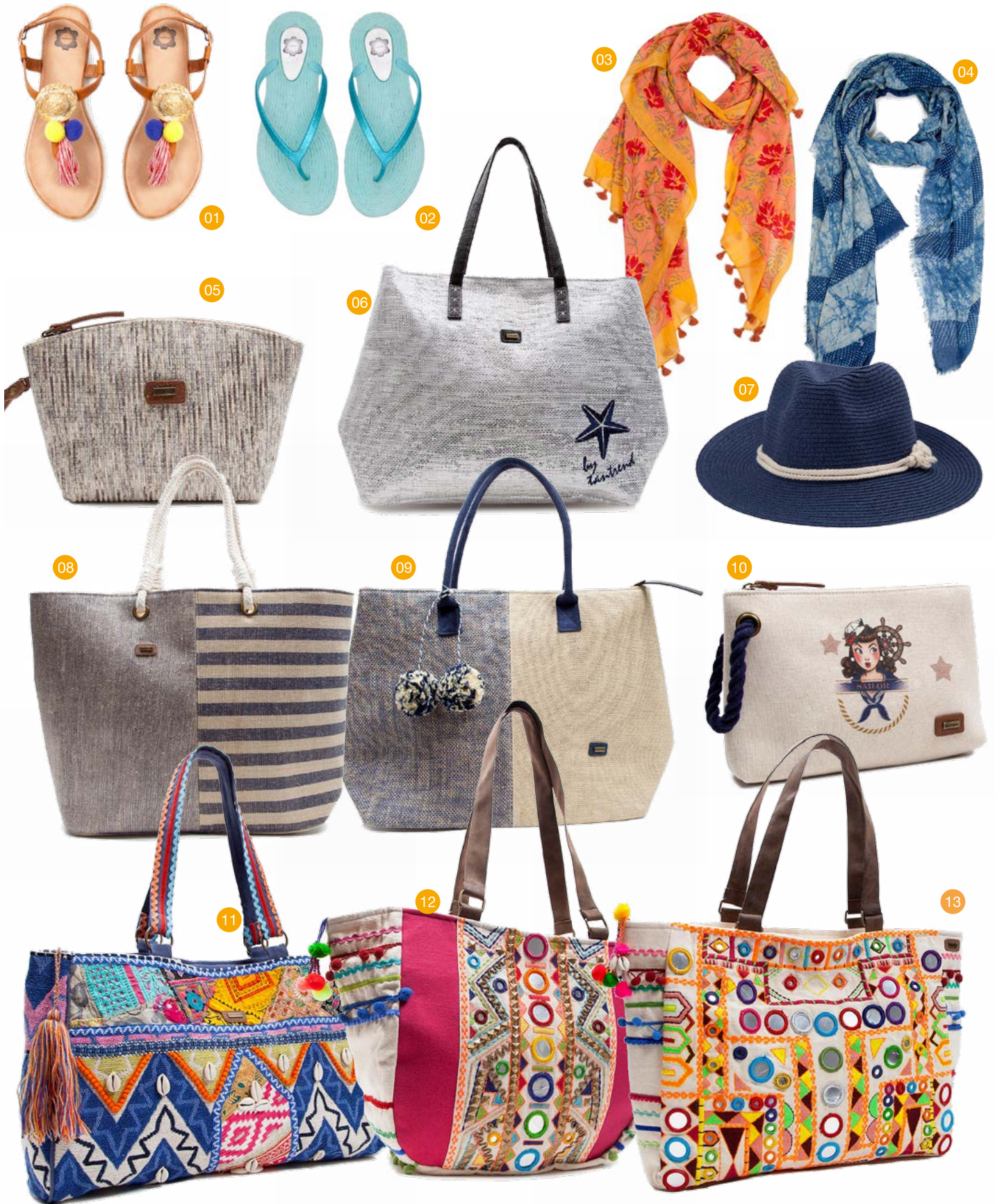
En esta página/In this page: 01 Sandalia/Sandalia 04600631. 02 Sandalia/Sandalia 04600627. 03 Pañuelo/Scarf 09270195. 04 Pañuelo/Scarf 09270185. 05 Neceser/Beauty case 05020015/1 . 06 Bolso/Bag 05020020. 07 Sombrero/Hat 04600609. 08 Bolso/Bag 05020016. 09 Bolso/ Bag 05020022. 10 Neceser/Beauty case 05020014/1. 11 Bolso/Bag 09280060. 12 Bolso/Bag 09280067. 13 Bolso/Bag 09280066.