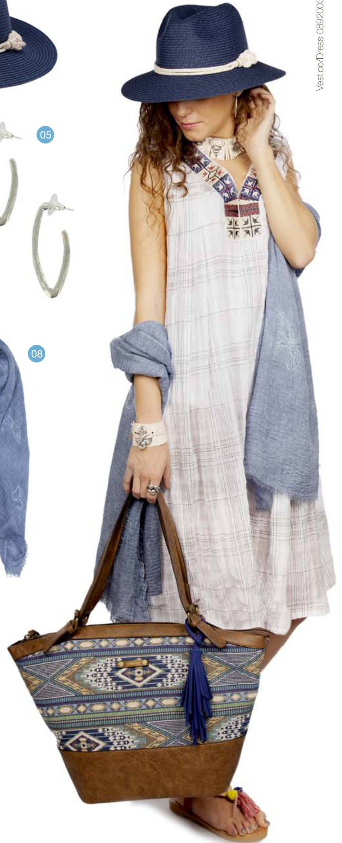
01 Collar/Necklace 03200066. 02 Sombrero/Hat 04600609. 03 Vestido/Dress 08920033. 04 Pulsera/Bracelet 03200067. 05 Pendientes/Earrings 03200081. 06 Anillo/Ring 06281715. 07 Sandalia/Sandal 04600631. 08 Pañuelo/Scarf 04600560. 09 Bolso/Bag 04570060.