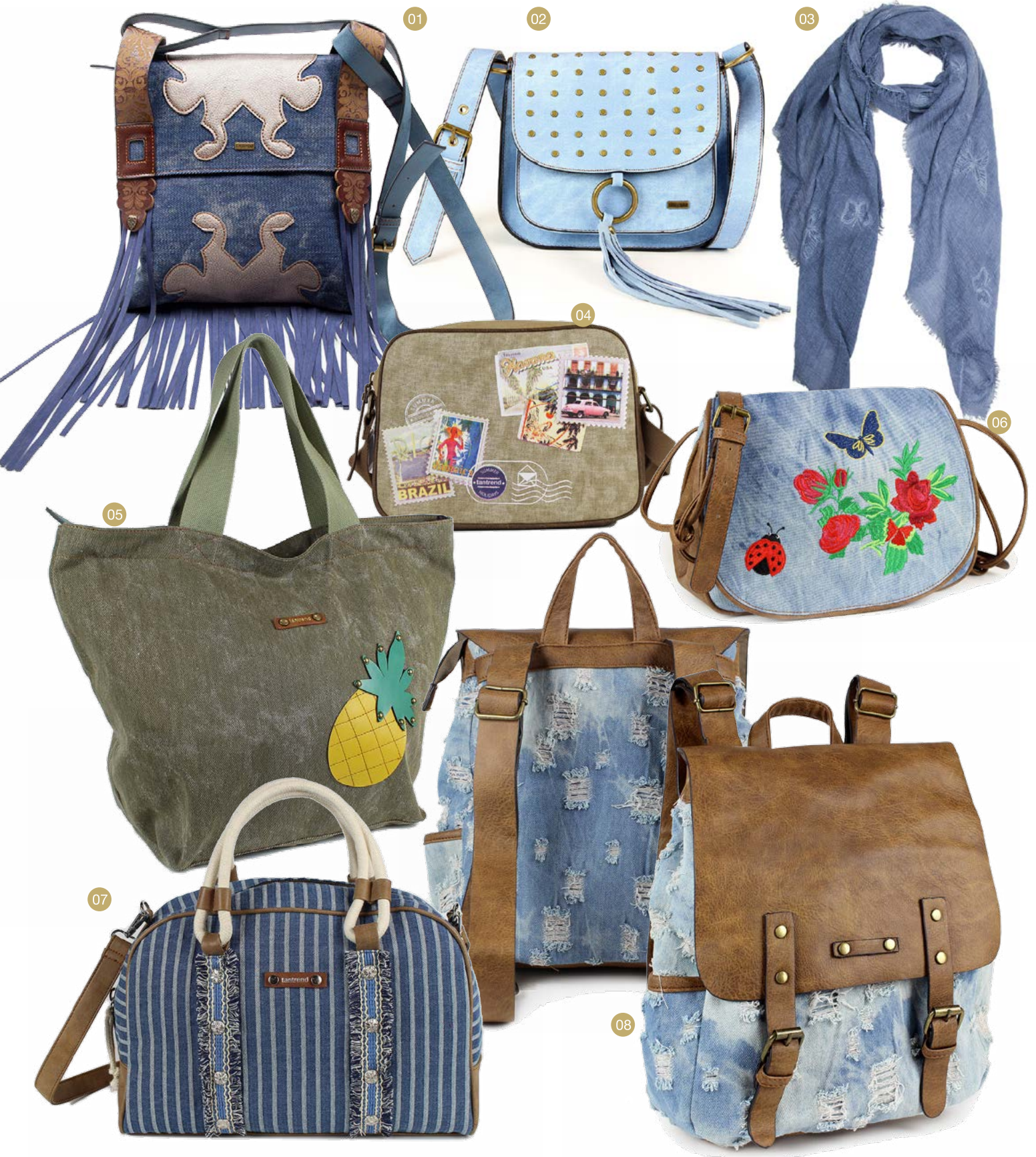
01 Bolso/Bag 04702698. 02 Bolso/Bag 04570053. 03 Pañuelo/Scarf 04600560. 04 Bolso/Bag 04702713. 05 Bolso/Bag 04702709. 06 Bolso/Bag 04570054. 07 Bolso/Bag 04702719. 08 Mochila/Backpack 04702705.